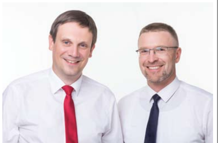
Seimo narys Tomas Tomilinas ir buvęs Socialinės apsaugos ir darbo ministras, Seimo narys Linas Kukuraičius.