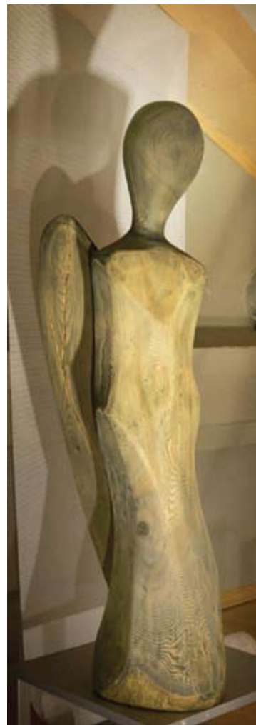
Šis angelas, „Atėjęs iš aukso pievų“, gyvena Anykščių angelų muziejuje.