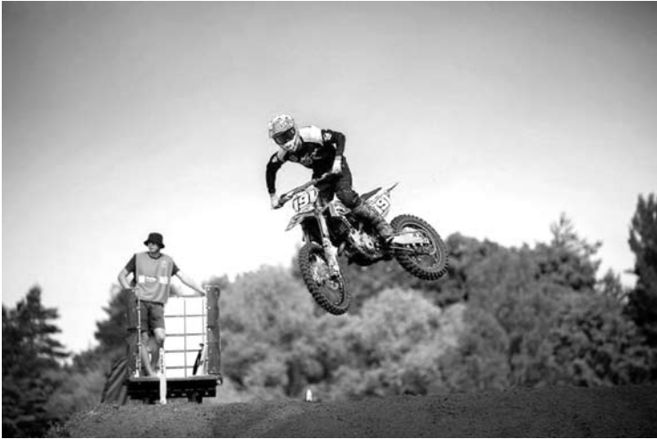
Motokrosas. Birželio 27-28 dienomis Mickūnų trasoje vyko Lietuvos motokroso čempionato I-ojo etapo varžybos.